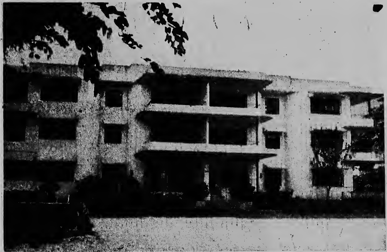
E anja aki, — pa ta precies 30 di October — Caraibische Commissie, ou tin su hoofdkwartier na Kent House na Trinidad (mira e foto) a cumpli diez anja, Den e diez anjanan aki mundo a bai dilanti cu pasonan gigantesco, pero nos mester bisa, cu e adelantacion aki y actividadnan tin di gradicé C.C., y cu e islan y territorionan tambe a probecha di dje. C.C. ta un iniciativa di Hulanda, Francia, EE.UU. y Inglaterra.